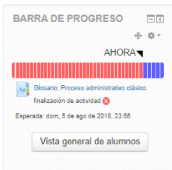
Figura 1. Barra de progreso, que ayuda a los estudiantes a seguir el avance en sus actividades.

del módulo de Administración en Enfermería, teniendo como resultado final un total de 38 actividades de aprendizaje, divididas equitativamente durante el semestre, los estudiantes debían realizar las actividades y subirlas a la plataforma, en ocasiones, hasta dos por semana, situación que fue muy compleja, pues los estudiantes no comprendían la lógica de las actividades, y en la mayoría de los casos no sabían usar la plataforma. Por tal motivo en el periodo intersemestral se decidió colegiadamente, realizar adecuaciones al curso, en general se modificaron todas las actividades, con la finalidad que su diseño exigiera de un mayor esfuerzo intelectual por parte de los estudiantes.